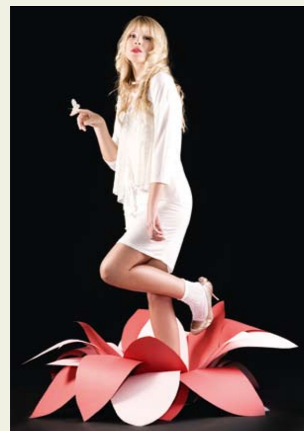
Kåre Mørkøres holdkammerater fik også opgaver i eventyrgenren. Øverst er det Snehvide og nederst Tommelise.